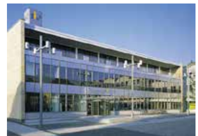
Landesbibliothekszentrum Rheinland-Pfalz in Koblenz

Am 30.06.13 schließt die Bibliothek der WGfF in Brühl. Danach gibt es eine Pause, in der die Bücher nach Koblenz transportiert und dort durch die Landesbibliothek Rheinland-Pfalz neu erfasst werden. Mit dieser Bibliothek hat die WGfF einen Leihvertrag geschlossen. Nach Abschluss der Erfassung wird sowohl die Ausleihe vor Ort als auch eine Fernleihe möglich sein. Die Bibliothek befindet sich in der Nähe des Koblenzer Hauptbahnhofs und ist somit gut erreichbar.