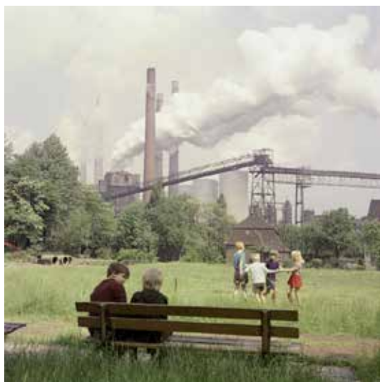
An der Zeche Scholven, Gelsenkirchen 1965; © Fotoarchiv Ruhr Museum, Foto: Heribert Konopka.

WAR WAS? Geschichtswettbewerb „Heimat im Ruhrgebiet“