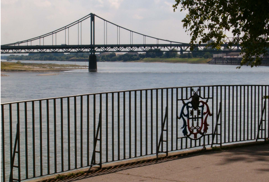
Die Uerdinger Rheinbrücke

An der Südseite des Marktes befindet sich noch das alte barocke Rathaus. Über dem Eingang steht eine Inschrift, aus der man in einem sogenannten Chronogramm die Jahreszahl 1725 herauslesen kann.